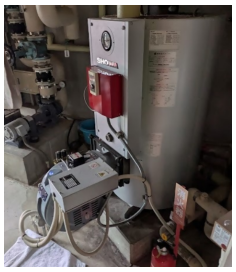
⑦消雪用圧送タンク